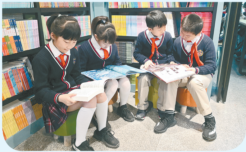
昨日是世界读书日,记者走进郑州市中小学校和,看看师生们如何以书为源,用书香装扮校园。

目前,沙口路站、西站街站至沙口路站区间、沙口路站至南阳路区间、出入场线区间均已移交铺轨单位,开始进入地铁铺轨作业阶段。