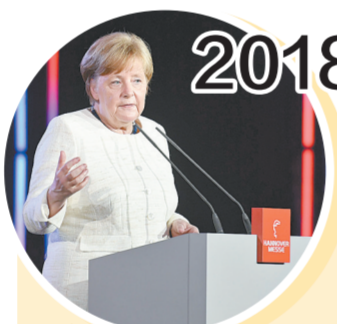
4月22日,在德国汉诺威,德国总理默克尔在汉诺威工业博览会开幕式上致辞。