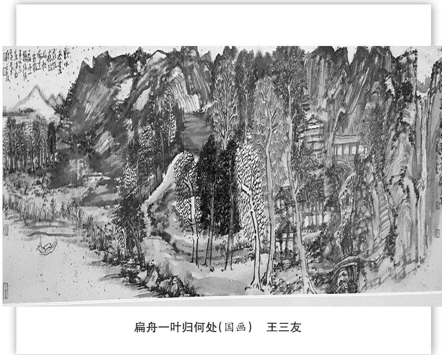
扁舟一叶归何处(国画) 王三友