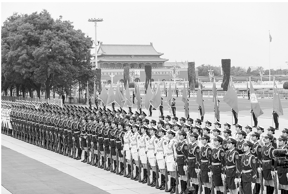
这是6月6日在欢迎仪式上拍摄的三军仪仗队。目前，仪仗队总人数由此前最大规模时的151人增加到224人。

6月6日下午，国家主席习近平在人民大会堂东门外广场举行仪式，欢迎吉尔吉斯斯坦总统热恩别科夫对中国进行国事访问。记者在现场发现，与此前相比，国事访问欢迎仪式多项内容发生了新变化，让人眼前一亮。据了解，这是经过改革后国事访问欢迎仪式的首次启用，充分展示了新时代大国外交新气象、新作为。此次国事访问欢迎仪式改革有哪些亮点？透露出怎样的信息？背后又有不为人知的故事？