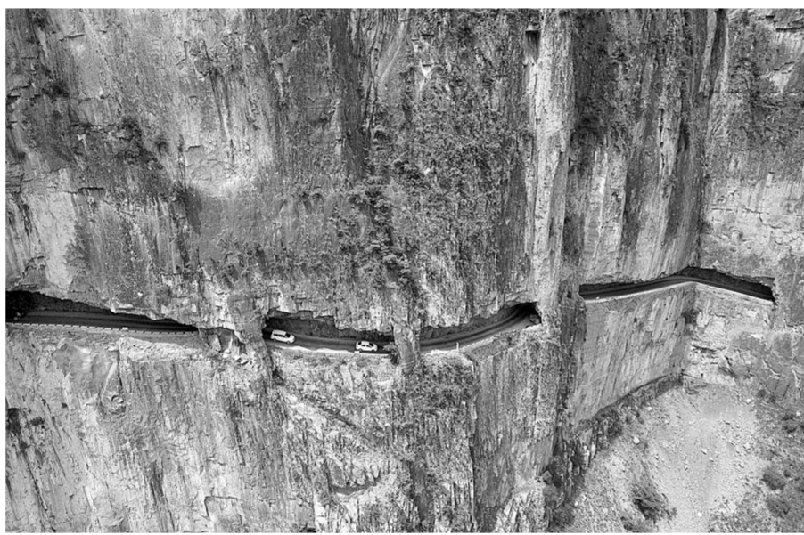
汽车行驶在山西省长治市平顺县神龙湾挂壁公路上(6月13日无人机拍摄)。

在山西省平顺县神龙湾村(原名井底村),一群堪称“当代愚公”的太行山农民,用15年时间在悬崖上开凿了一条1526米的“天路”。这条“天路”也实现了神龙湾村人走出大山、摆脱贫困的梦想。