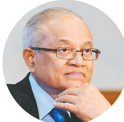
这是2008年10月29日在马尔代夫马累拍摄的加尧姆资料照片。

新华社科伦坡6月14日电(记者 朱瑞卿 唐璐)马累消息:据当地媒体报道,马尔代夫刑事法庭13日以妨碍司法执行罪判处前总统加尧姆19个月有期徒刑。报道说,刑事法庭当天仍以相同罪名判处马尔代夫最高法院首席法官阿卜杜拉·赛义德和法官阿里·哈米德19个月有期徒刑。同加尧姆一样,他们在被警方逮捕时,均拒绝交出手机。据报道,由于涉嫌颠覆政府,上述三人目前还在受审。今年2月1日,马尔代夫最高法院突然发布裁决令,要求无罪释放前总统纳希德等9名反对派领导人。4日,最高法院再次发布裁决令,称因总统亚明拒绝释放反对派领导人,将对其进行弹劾。亚明于5日晚间宣布马尔代夫进入为期15天的全国紧急状态。6日,最高法院宣布,撤销释放纳希德等9名反对派领导人的裁决。在亚明的申请下,马议会20日召开特别会议,批准将全国紧急状态延长30天。进入全国紧急状态后,马尔代夫警方以调查需要为由逮捕了前总统加尧姆、首席法官阿卜杜拉·赛义德、法官阿里·哈米德等人。3月21日,马尔代夫政府称,将以恐怖主义和阻碍司法等罪名起诉加尧姆等人。马尔代夫全国紧急状态已于3月22日结束。