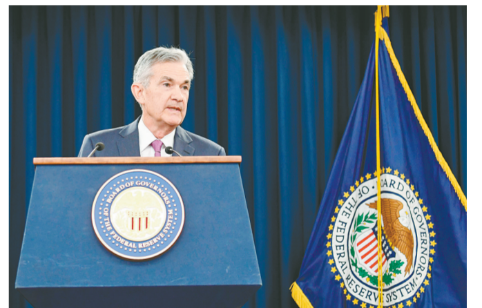
6月13日,在美国首都华盛顿,美国联邦储备委员会主席鲍威尔在新闻发布会上讲话。

新华社华盛顿6月13日电(记者 高攀)美国联邦储备委员会13日宣布将联邦基金利率目标区间上调25个基点到1.75%至2%的水平。这是美联储今年以来第二次加息,符合市场普遍预期。美联储当天结束货币政策例会后发表声明称,5月份以来的信息显示,美国就业市场继续保持强劲,经济活动稳步扩张。近期数据显示美国家庭消费增长回升,企业固定资产投资继续强劲增长。美国整体通胀和剔除食品与能源的核心通胀水平都已接近美联储2%的目标。声明说,美国经济面临的风险大致平衡,美联储预计美国经济中期将持续扩张,就业市场将保持强劲,通胀率将处于美联储“对称性的2%目标”附近。美联储当天发布的季度经济预测显示,美联储预计今年美国经济将增长2.8%,略高于3月份预测的2.7%;美联储预计2019年和2020年美国GDP将分别增长2.4%和2%,与3月份的预测一致。此外,美联储官员预计今年共加息4次,多于3月份预测的3次;美联储官员预计2019年和2020年将分别加息3次和1次。美联储主席鲍威尔在当天的新闻发布会上表示,从明年1月开始,每次货币政策例会后都将召开美联储主席新闻发布会,向公众解释货币政策决定。目前,美联储主席仅每个季度举行一次新闻发布会。自2015年12月启动本轮加息周期以来,美联储已加息7次,并开启缩减资产负债表计划,以逐步退出金融危机后出台的超宽松货币政策。