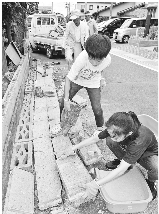
6月19日,在日本大阪府茨城,居民清理地震造成的建筑碎片。日本大阪府18日早上发生6.1级地震,目前已造成至少4人死亡、370多人受伤。

特朗普15日告诉媒体记者,可能与普京在今年夏天会晤。本月8日前往加拿大参加七国集团峰会前,他提议七国集团允许俄罗斯回归集团。新华社特稿