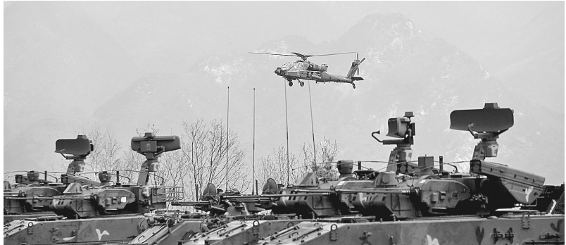
这张资料照片显示的是,2017年4月21日,一架美军“阿帕奇”攻击直升机在韩国抱川参加美韩联合军演。

美国国防部当地时间18日宣布,按照总统特朗普此前的承诺,美军已暂停有关在8月与韩国举行联合军演的计划。韩国国防部当地时间19日对此予以确认,并表示双方尚未决定是否取消其他演习。