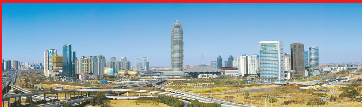
郑东新区风景秀美