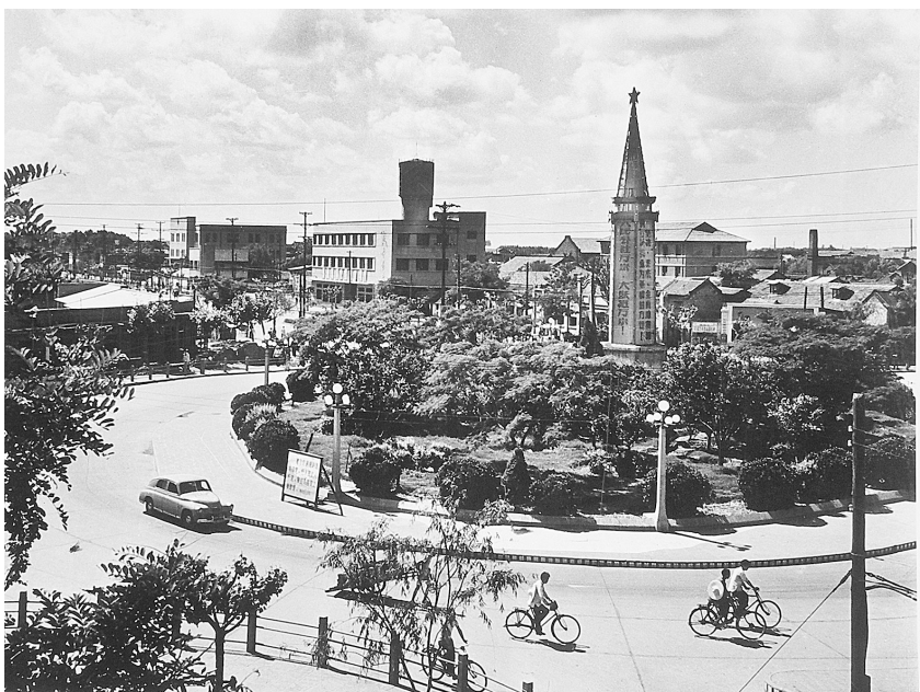
20世纪60年代的二七塔