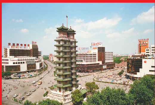
20世纪90年代的二七塔