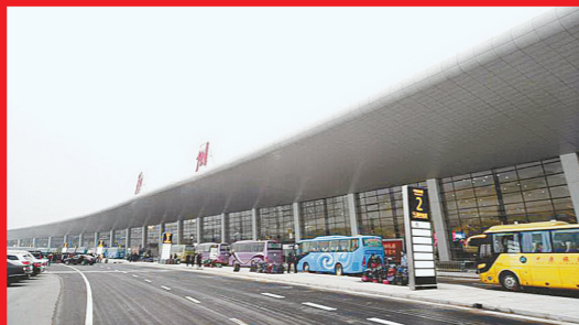
高铁航空提升郑州大枢纽地位