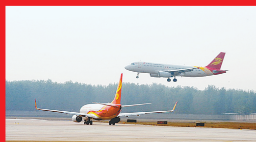
郑州航空港“立体枢纽”优势凸显