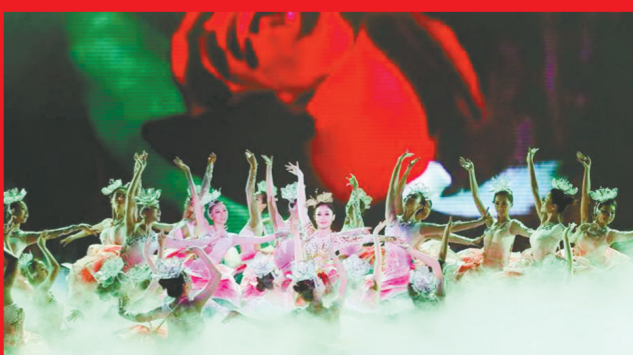
文艺演出丰富市民生活