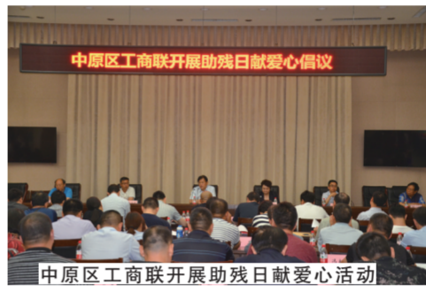
中原区工商联开展助残日献爱心活动

探索“六助一”救助服务平台，开展帮扶救助活动。继续开展“汇聚社会各界力量，结对帮扶困难家庭”工作，建立常态化帮扶机制，采取“结对子”的模式，搭建“六助一”帮扶平台，以医疗服务为主，资金支持为辅，精准帮扶，立体救助，确保73户困难家庭大病能医治、生活有保障。在春节等传统节日，对重点帮扶家庭进行慰问，并持续进行就业和医疗帮扶。狠抓宣传调研信息工作，广泛宣传统战工作。结合统战工作实际，抓好“信息源”，发现“新闻点”，加强专职信息员队伍建设，形成人人参与写信息的良好氛围，发挥民主党派、工商联、新阶层、台胞台属等人士的优势特长，广泛收集、深入发掘信息，提高统战宣传调研信息工作质量水平，广泛宣传，进一步增强统一战线凝聚力。上半年共刊发新闻稿件81篇，其中市级统战信息采用40篇。