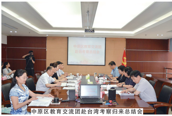
中原区教育交流团赴台湾考察归来总结会

紧跟全区改革发展新动向，做到中原区委、区政府工作中心指向哪里，统一战线就聚焦到哪里，工作就延伸到哪里，引导统一战线