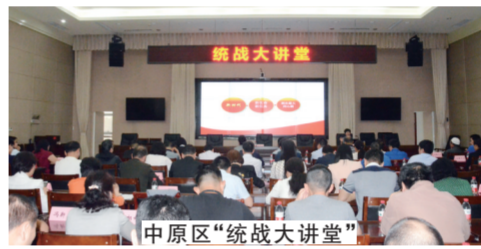
中原区“统战大讲堂”