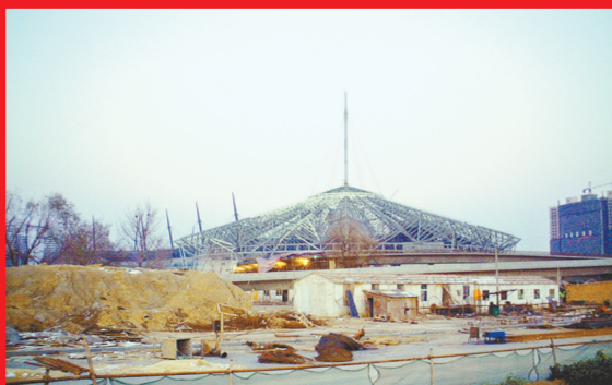
国际会展中心建设初期