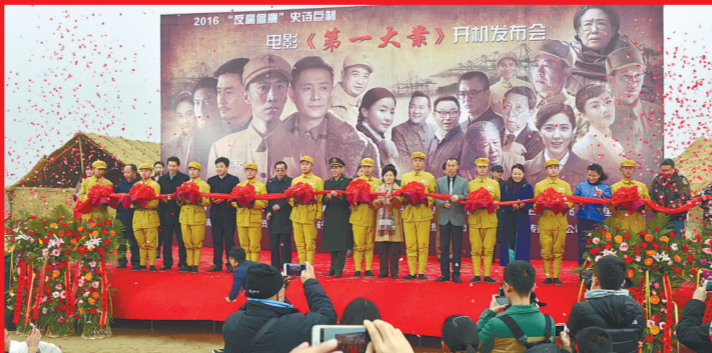
郑州报业集团布局“多元化发展”,涉足影视制作、旅游酒店、互联网金融、互联网双创、文化教育等多个板块和领域