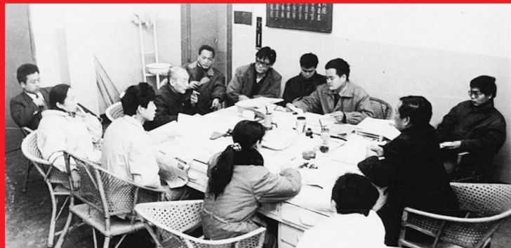
1992年冬,郑州晚报编辑室正在召开编前会