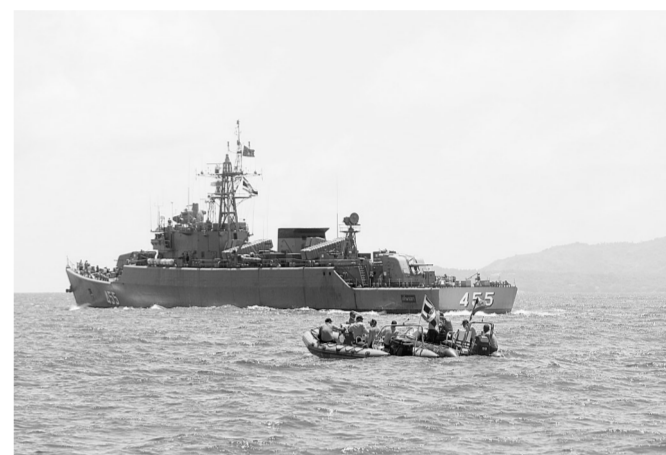
7月7日，在泰国普吉，救援人员在游船倾覆附近的海域进行搜救。

由外交部领事司副司长陈雄风任组长的中国政府联合工作组于6日晚抵达普吉，当天深夜与泰方工作组展开首次联席会议，明确下一步任务，包括争分夺秒搜救失踪人员、妥善照料和安置有关伤员及家属，为下一步善后事宜做好准备等。