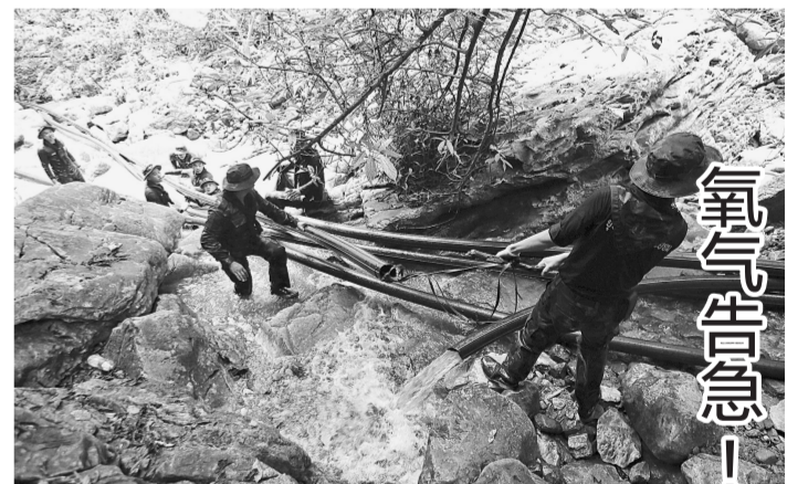
7月7日，在泰国清莱，泰国士兵参与救援。

泰国一支少年足球队被困洞穴已经14天，眼下洞穴内空气含氧量跌至15%的危险水平，给救援行动带来巨大时间压力。