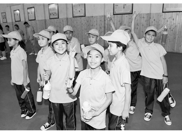
力，让孩子在活动中开放自我、超越自我，从而开发自身潜能，肯定自我价值。”郑州慈善总会相关负责人介绍说。

本报(记者 李娜 文李焱图) 游览少林、诵读经典、品读诗词、聆听古琴、初悟禅宗……这样的夏令营，是不是很有吸引力？7月9日上午，2018首届“童心桥”郑哈两地儿童互动夏令营在登封正式开营，来自新疆哈密和郑州的共58名困境儿童将共同度过为期10天的夏令营。