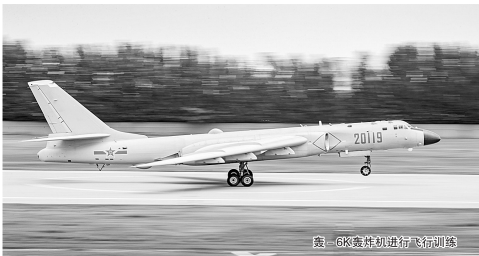
轰-6K轰炸机进行飞行训练

记者12日从中国空军参加“国际军事比赛-2018”媒体吹风会上获悉，空军将派出轰-6K轰炸机、歼-10A歼击机、歼轰-7A歼击轰炸机和伊尔-76、运-9运输机等五型战机和一支空降兵分队，赴俄罗斯参加即将开幕的“国际军事比赛-2018”。其中，轰-6K轰炸机和运-9运输机均是首次出国参赛。