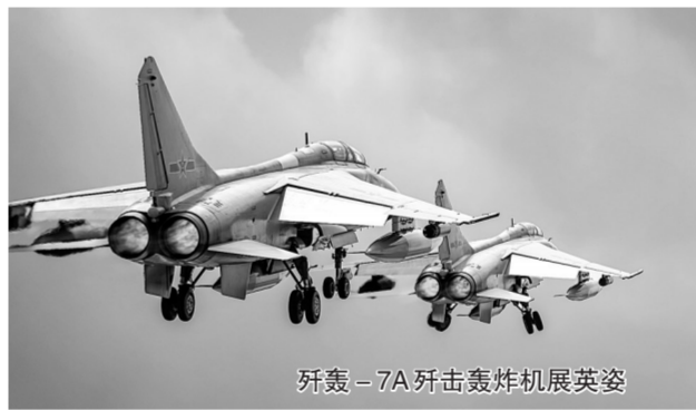
歼轰-7A歼击轰炸机展英姿