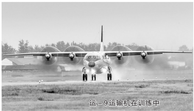
运-9运输机在训练中

记者12日从中国空军参加“国际军事比赛-2018”媒体吹风会上获悉，空军将派出轰-6K轰炸机、歼-10A歼击机、歼轰-7A歼击轰炸机和伊尔-76、运-9运输机等五型战机和一支空降兵分队，赴俄罗斯参加即将开幕的“国际军事比赛-2018”。其中，轰-6K轰炸机和运-9运输机均是首次出国参赛。新华社发