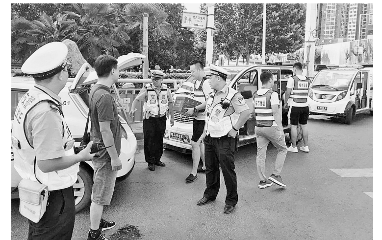
铭路街道城市管理工作人员联合交警三大队一中队对辖区交通进行综合整治,为道路交通畅通保驾护航。

特色一方案”精准施治的原则,提升楼院的硬件设施和软件“装备”,努力实现无主管楼院小环境与周边环境和谐发展。通过网上招投标,公开招聘物业管理服务机构,对辖区49个无主管楼院进行外包管理,规范清扫保洁、秩序维护、日常维修人员的服务行为,实现无主管楼院亮、净、美、绿、畅的效果。