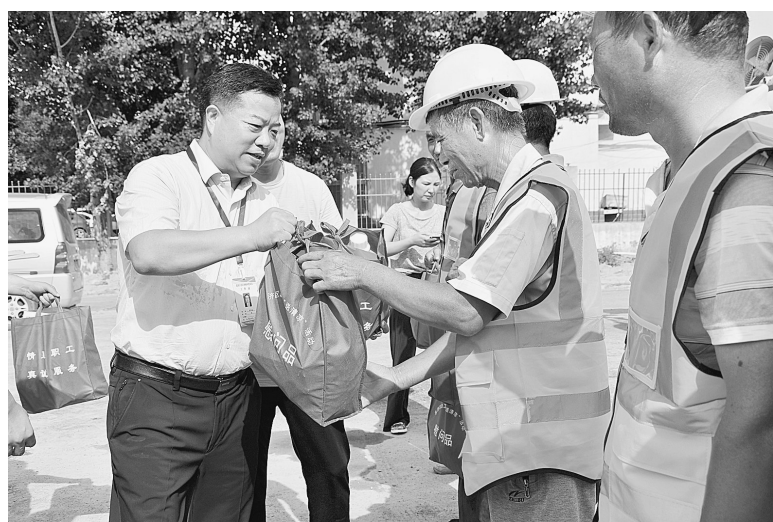
昨日,惠济区开展“党建主题月,夏季送清凉”活动,20余名党员志愿者走进建筑工地,为农民工送防暑用品。