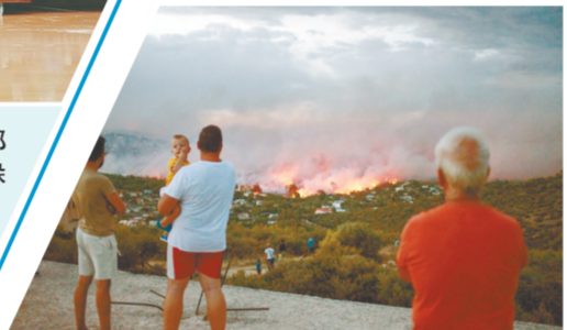
7月23日,在希腊雅典附近的拉菲那镇,人们在观望火情。

据新华社雅典7月24日电(记者 刘咏秋)据希腊雅典通讯社24日报道,首都雅典附近23日发生的森林火灾造成至少50人死亡,另有约150人受伤。