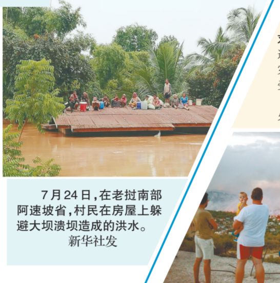
7月24日,在老挝南部阿速坡省,村民在房屋上躲避大坝溃坝造成的洪水。

新华社万象7月24日电(记者 章建华)老挝巴特寮通讯社24日报道,老挝南部阿速坡省一水电站23日晚发生溃坝事故,已导致数人死亡、数百人失踪。