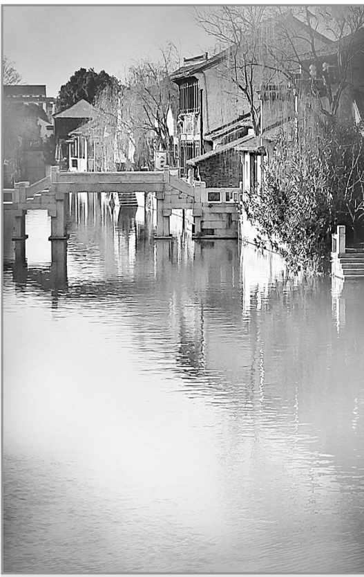
水乡小镇