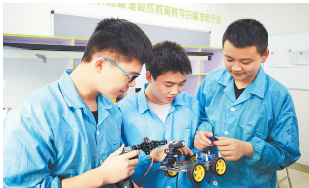
学生在学校的创客基地动手实践

短短十多年间,郑州职业教育体系日益立体和丰富。一系列的有力举措,让郑州职业教育改革发展日益深化,服务经济社会能力不断提升,吸引力显著提高。