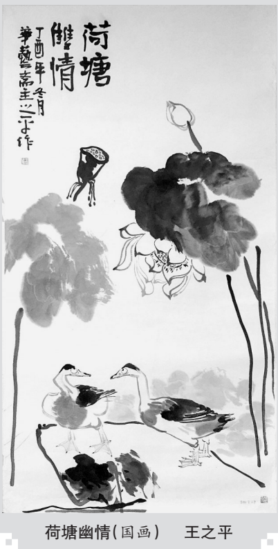
荷塘幽情(国画) 王之平