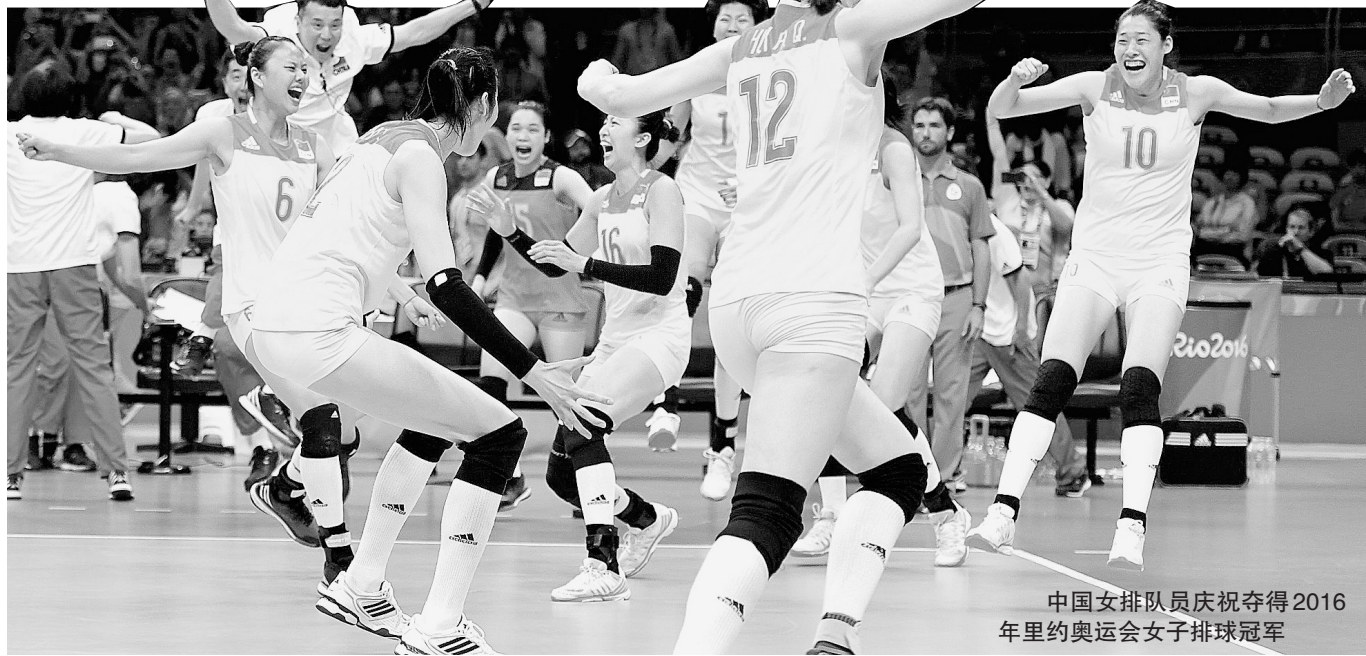
中国女排队员庆祝夺得2016年里约奥运会女子排球冠军

本报讯(记者 陈凯)昨日,“2018 全民健身日河南省体育中心户外乒乓球场地落成启动仪式暨乒乓球争霸赛”活动在省体育中心户外乒乓球场地举行。随着该户外乒乓球场地落成,喜欢打乒乓球的市民朋友,从此又多了一个打乒乓球健身的好去处。 作为全民健身服务重要阵地的户外乒乓球场地,一直以来都是乒乓球爱好者参与全民健身的首选。为了给广大乒乓球爱好者提供更多免费、舒适的健身场所,省体育局安排专项资金对省体育中心户外乒乓球场地进行升级改造,经过为期3个多月的紧张施工,现已竣工交付使用,并免费向社会开放。 本次在新落成的省体育中心户外乒乓球场地举行的乒乓球争霸赛,旨在迎接今年8月8日即将到来的全国第十个“全民健身日”。比赛吸引了众多爱好者参赛,这些爱好者中既有70多岁的老人,也有10多岁的孩子,大家在激烈角逐的同时,也纷纷对新设施点赞。