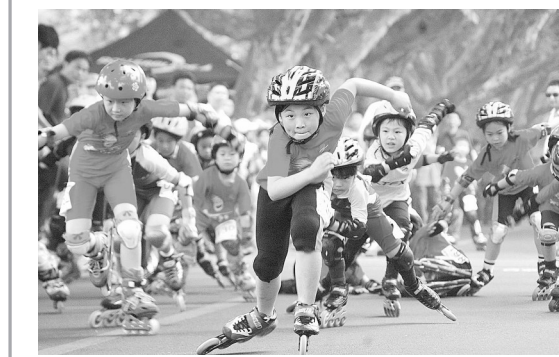
小选手在杭州西湖白堤举行的第三届青少年环西湖轮滑邀请赛上追逐