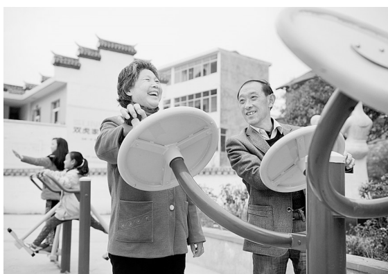
陕西平利县城关镇居民在药妇沟社区健身