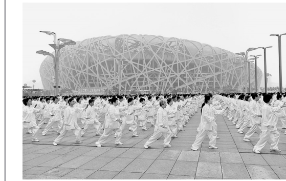
2009年8月8日,34000人在“鸟巢”前进行太极拳表演,庆祝全国首个“全民健身日”。