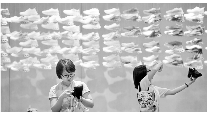
参观者在2017年第十九届(晋江)国际鞋业暨第二届国际体育产业博览会上了解国产运动鞋