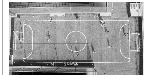
南师附小叠山路的孩子在教练的带领下,在“空中微球”训练。