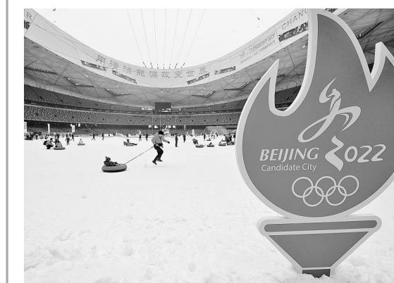
游客在2015年第六届“鸟巢”欢乐冰雪季上体验冰雪乐趣