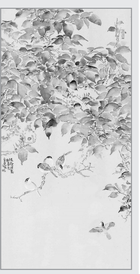
绿荫深处别有天(国画) 白金尧