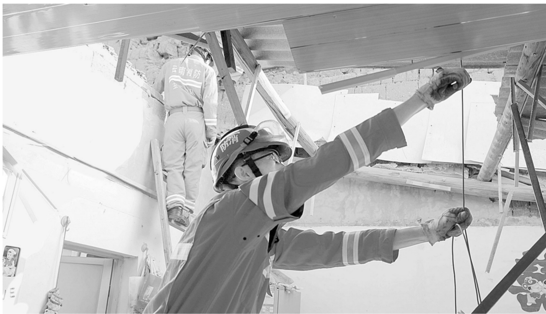
消防队员在清理受灾房屋

据新华社昆明8月13日电(记者 丁怡全 林碧峰)云南省民政厅通报,截至13日18时30分,当日凌晨玉溪市通海县发生的5.0级地震造成通海县、江川区、华宁县4.8万余人受灾,18人受伤,房屋不同程度受损6000多户。记者在灾