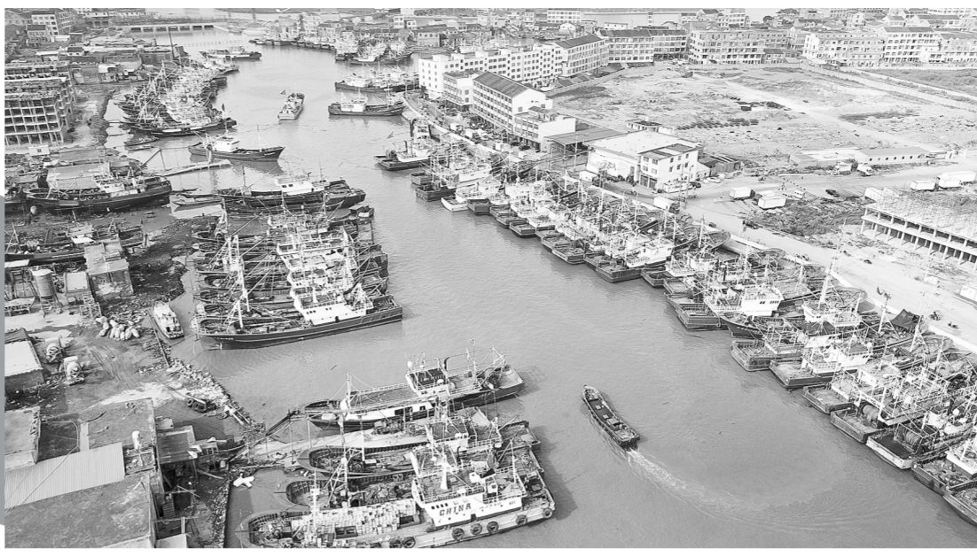
渔船返回浙江温州一渔港躲避台风

中央气象台13日18时继续发布暴雨黄色预警。目前,我国有3条明显雨带,从南到北降水显著;西北太平洋和南海出现3个台风共存,其中台风“摩羯”携风雨影响黄淮江淮。