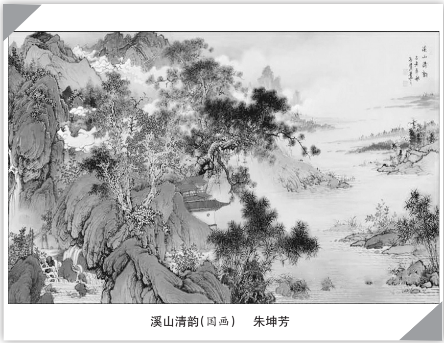
溪山清韵(国画) 朱坤芳