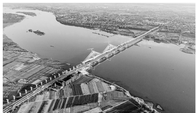
8月20日航拍的蒙华铁路汉江特大桥。当日，由中铁十一局集团承建的蒙华铁路汉江特大桥斜拉索全部完成。蒙华铁路汉江特大桥位于湖北省襄阳市区上游约3公里的汉江上，总长5242米，是蒙华铁路重点控制性工程之一。该桥江面共18座桥墩，位于江面上的主桥为双塔五跨部分斜拉桥，最大跨径248米。

《通知》强调，落实实名制制度，加强网络直播管理，建立主播黑名单制度，健全完善直播内容审核、审查制度和违法有害内容处置措施。网络接入服务提供者、应用商店应立即组织存量违规网络直播服务清理。