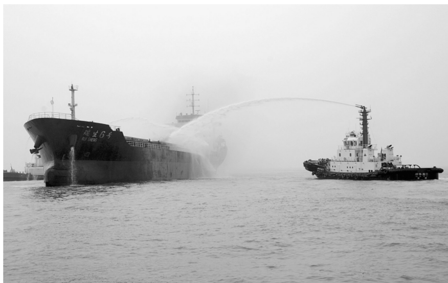
8月21日,由河北、天津、山东三地海警部门共同主办的2018年渤西三地海上搜救暨溢油应急联合演习在河北沧州黄骅港1号锚地附近海域举行。演习内容包括直升机转移伤病人员、搜寻救助落水人员、扑灭船舶火灾、溢油处理等,15家相关单位的13艘船艇、1架直升机和200余人参加演习,旨在构筑海上应急防线,有效应对突发事件。图为参加演习的救援船舶对“事故船舶”进行灭火。