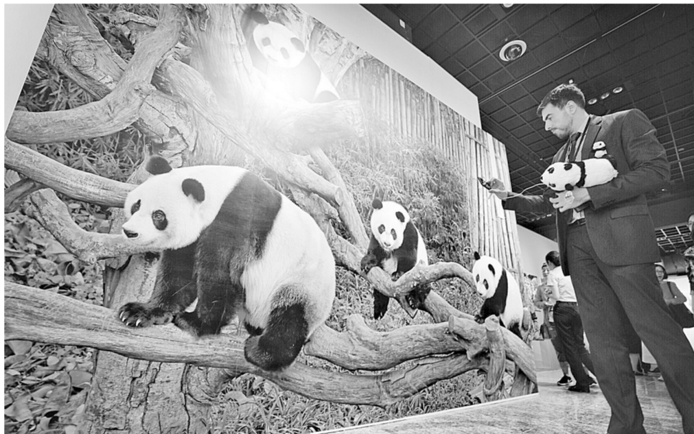
8月23日,“首届中国大熊猫国际文化周”在北京中华世纪坛开幕。活动以“熊猫文化,世界共享”为主题,举办展览、书籍分享、电影展映等活动。新华社发

“不断增强新知识、熟悉新领域、开拓新视野,增强本领能力,加强调查研究,不断增强脚力、眼力、脑力、笔力”