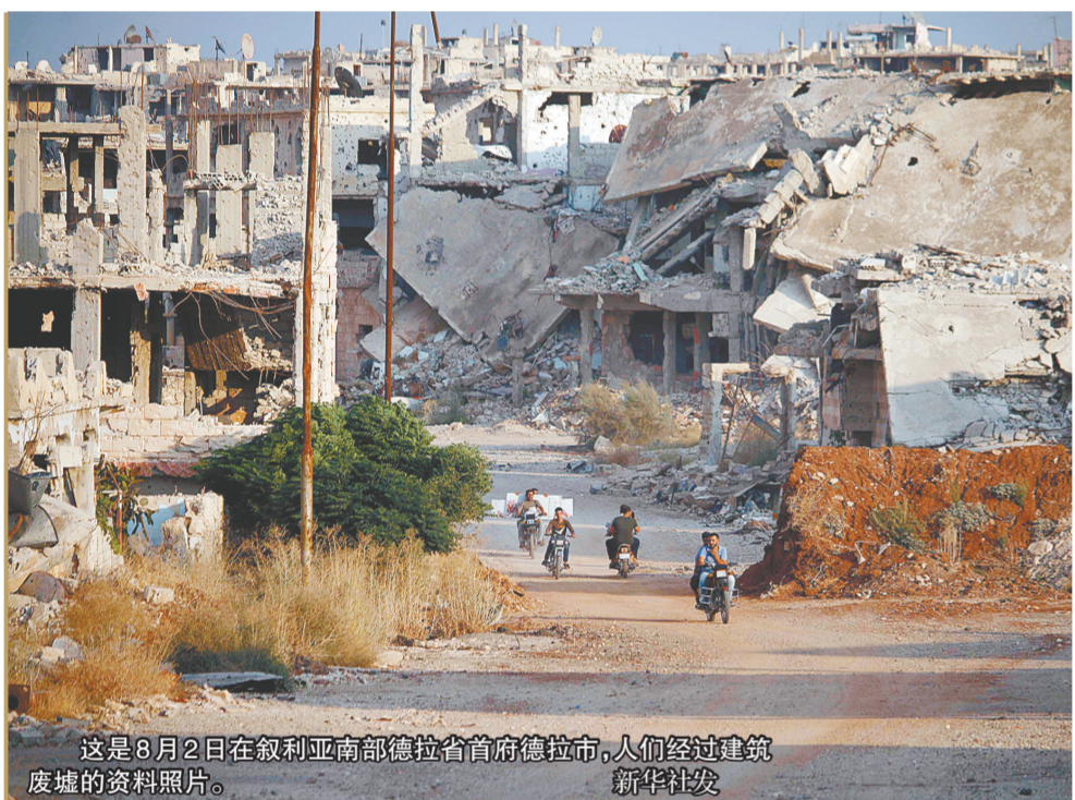
这是8月2日在叙利亚南部德拉省首府德拉市，人们经过建筑废墟的资料照片。

伊德利卜省“导演一场化武袭击”。21日，美国、英国、法国发表联合声明，警告称其将“适当”回应叙政府任何使用化学武器的行为。声明同时表示，三国“严重”关切叙政府军在伊德利卜省可能的军事行动。4月7日，叙利亚首都大马士革东古塔地区的杜马镇据称发生“化武袭击”事件。叙利亚政府坚决否认使用化学武器的指责。美国东部时间4月13日晚，美国联合英国、法国对叙利亚军事设施进行“精准打击”。此次军事行动的合法性遭到一些国家质疑，国际社会纷纷呼吁公正调查叙“化武袭击”事件。