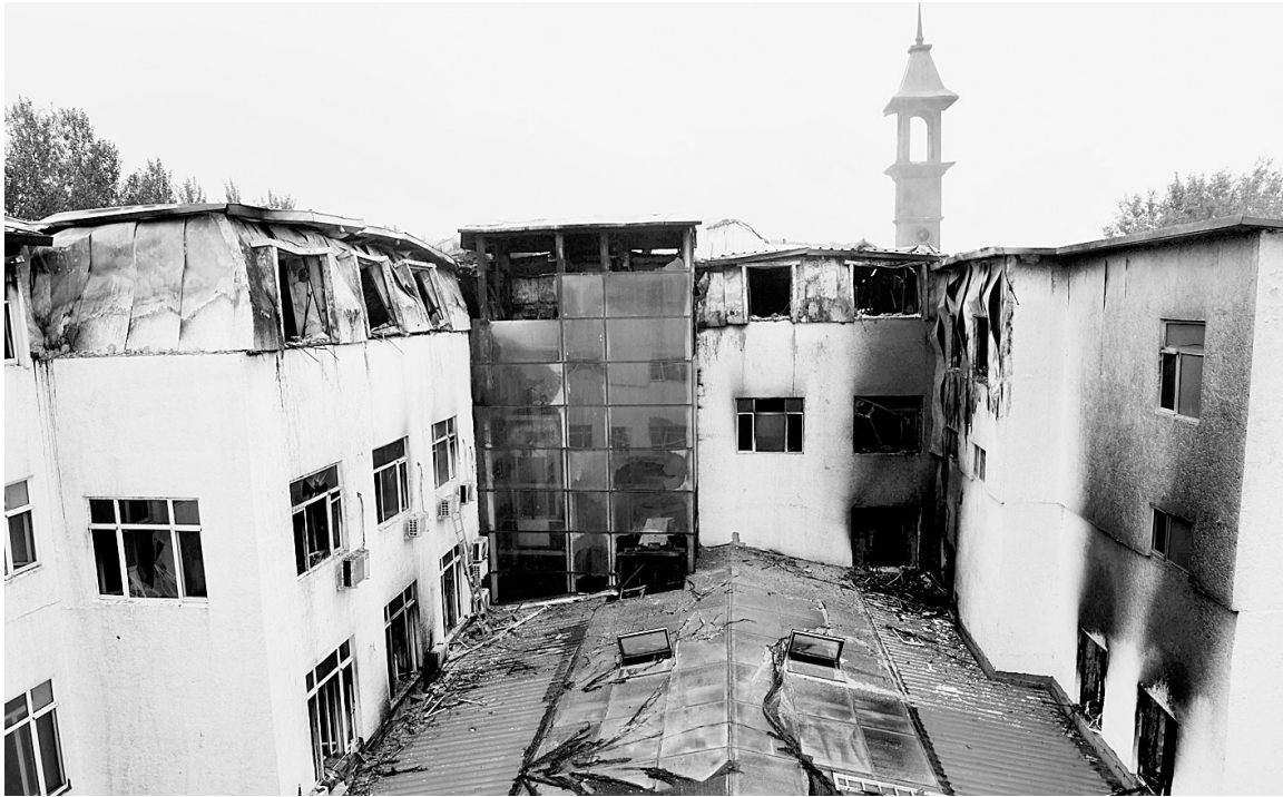
酒店发生火灾的客房楼体

据新华社哈尔滨8月25日电 记者从哈尔滨市政府25日下午举行的新闻发布会上了解到,“8·25”松北区重大火灾事故过火面积约400平方米,迄今已造成19人死亡。目前应急管理部已派出工作组赶赴现场。