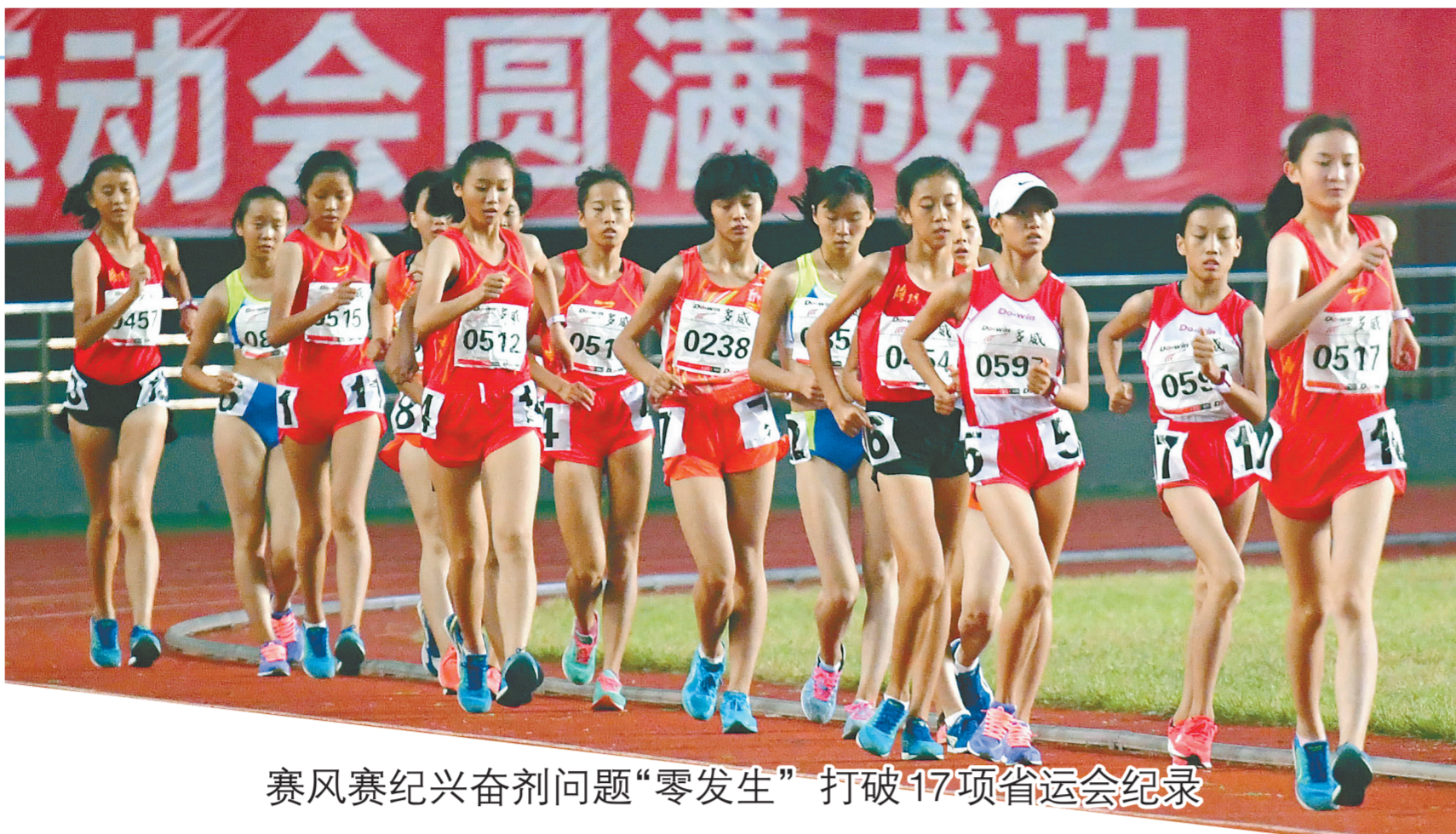
赛风赛纪兴奋剂问题“零发生”打破17项省运会纪录