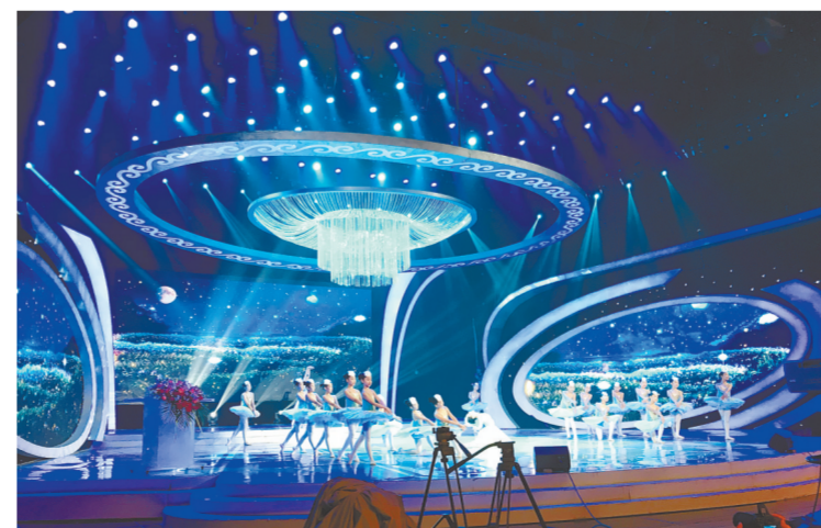
发布会现场的芭蕾舞表演

据《星光大道》栏目导演李建章介绍,河南有着浓郁的地域风情和多元共存的文化品格,此次《星光大道》走进河南,希望能从河南充分挖掘具有河南地区民间文化才艺的“百姓之星”,宣传当地的乡土人情和特色文化,向全国展现河南独特的文化魅力。同时,此次活动还将在河南开展广泛长期的公益活动,在师资匮乏的地区搭建一到两所“星光音乐教室”,为学校配备新的桌椅和音乐教室,同时还将开展校园音乐活动,积极组织优秀选手走进教室,开展一对一的助学帮扶,让孩子们享受到音乐的快乐。