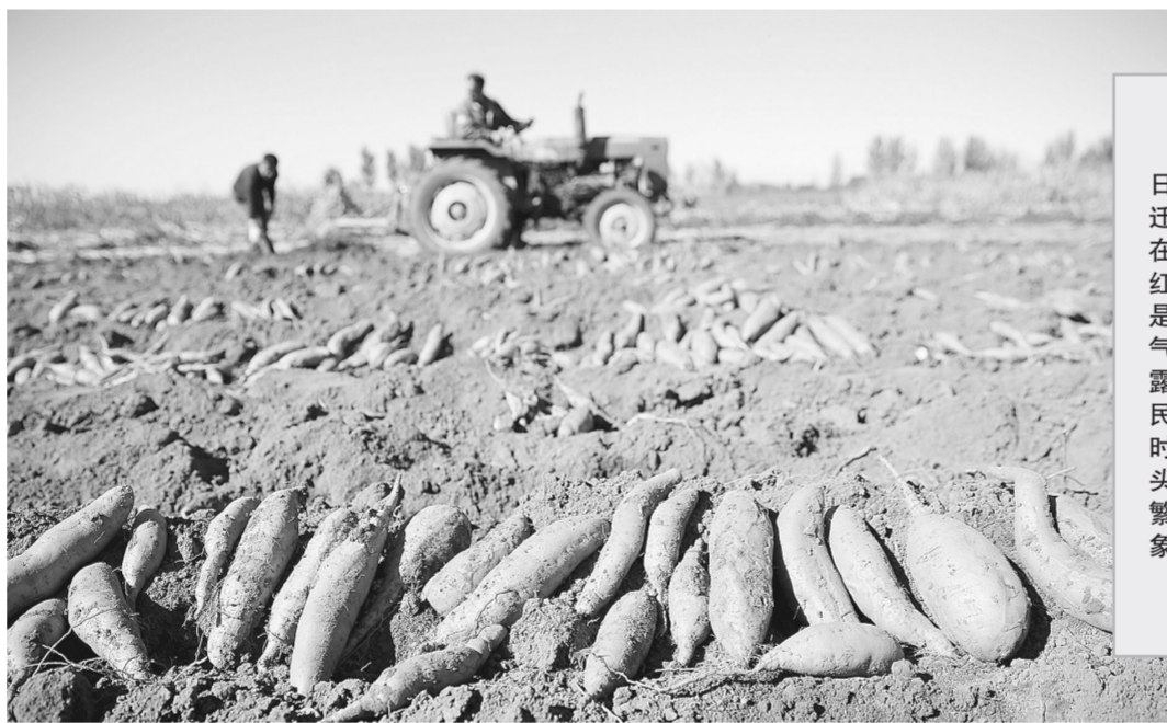
10月8日,河北省迁西县农民在田间收获红薯。当日是二十四节气中的寒露,各地农民抢抓农时,田间地头呈现一片繁忙的景象。新华社发

国家税务总局通知明确,从2018年10月10日起,各地税务机关通知本地区影视制作公司、经纪公司、演艺公司、明星工作室等影视行业企业和高收入影视从业人员,根据税收征管法及其实施细则相关规定,对2016年以来的申报纳税情况进行自行自查自纠。对在2018年12月底前认真自查自纠、主动补缴税款的,免予行政处罚,不予罚款。从2019年1月至2月底,税务机关根据纳税人自查自纠等情况,有针对性地督促提醒相关纳税人进一步自我纠正。对经提醒自我纠正的纳税人,可依法从轻、减轻行政处罚;对违法情节轻微的,可免予行政处罚。从2019年3月至6月底,税务机关结合自查自纠、督促纠正等情况,对个别拒不纠正的影视行业企业以及从业人员开展重点检查,并依法严肃处理。2019年7月底前,对在规范影视行业税收秩序工作中发现的突出问题,要举一反三,建立健全规范影视行业税收管理长效机制。在规范影视行业税收秩序工作中,对发现税务机关和税务人员违法违纪问题,以及出现大范围偷逃税行为且未依法履职的,要依法依规严肃查处。