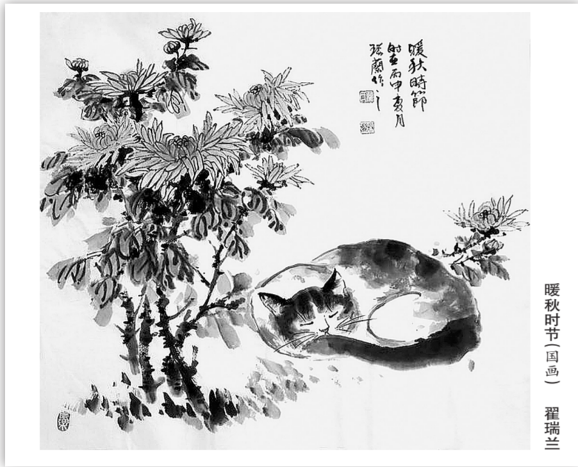
暖秋时节画 程瑞兰