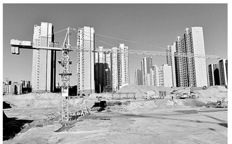
经开五中施工现场