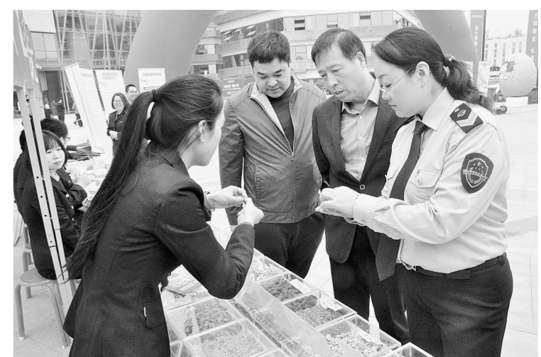
昨日,惠济区食品药品监督管理局在美憬万科广场开展了以“安全用药,共享健康”为主题的大型广场宣传咨询活动,向过往群众传播安全合理科学用药理念。

化面积约23.95万平方米,今年续建5个标段,主要包括道路中间2米宽分车带和两侧各30米绿化带。 截至目前,该项目已完成总任务量的85%,预计2018年底完工。该工程的完工,将进一步优化巩义生态环境,提升市民的幸福指数。