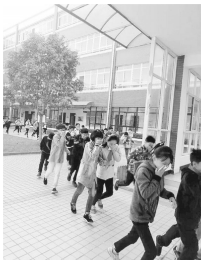
帝湖小学师生在消防演练中有序撤离

“遇到火情，我们要听从指挥，捂住口鼻，弯着腰，沿疏散路线快速撤离。”“这样的活动帮助我们掌握了基本的防火常识，我要向家人和朋友宣传消防知