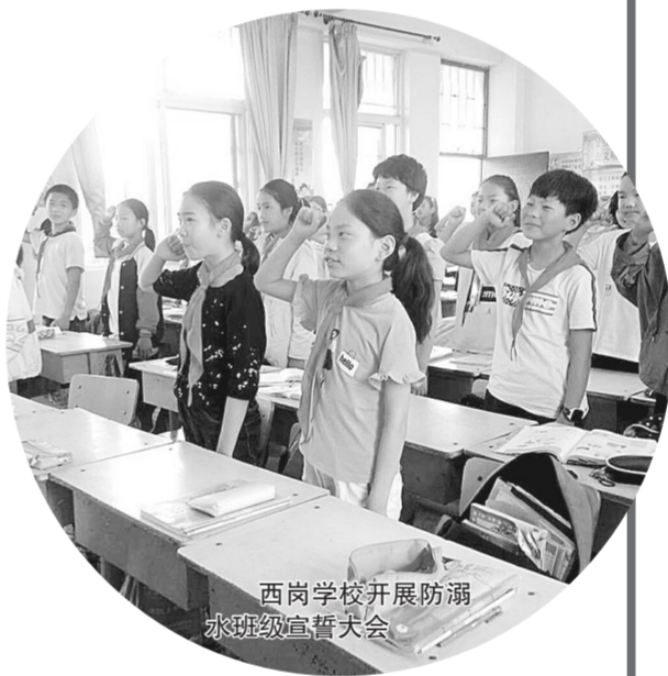
西岗学校开展防溺水班级宣誓大会

学校注重发挥家长的安全教育作用，通过校园安全教育平台及时组织学生及家长进行安全教育学习及培训，使学生家长在安全教育方面能够发挥更大作用。每年的3月、5月、6月及9月开学初，学校会发放《致家长的一封信》，与家长签订防溺水安全责任书，并在暑假不定期发动家校通讯信息，提醒家长做好监护责任；借助家长会、家长QQ群等形式，构建家校联管常态化模式。