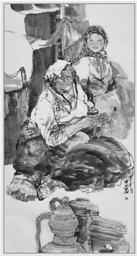
高原母亲(国画) 张宽武

20世纪90年代以前,乔家门的最高建筑是80年代建造的主体为7层的郑盛宾馆。如今郑盛宾馆作为这条街上唯一保留下来的老建筑,早已被新建的商厦和耀眼的广告宣传牌所掩盖,不仔细寻找都找不到。我家的老宅就在郑盛宾馆旁边,每每经过那里,我都要停一停、看一看,常常感慨——乔家门的变化太大了,郑州的变化太大了。