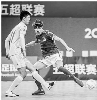
河南信大参加五超联赛

重回中超，显示了球队较强的韧性和百折不挠的足球精神。自1994年中国足球职业化改革以来，建业足球是一支从未更换过赞助商的民营足球俱乐部；也是中国历史较长的职业足球队；还是“职业经验”丰富的足球队；打过乙级联赛、甲级联赛、超级联赛，还打过亚冠联赛。当然，它也是中国为数不多的拥有自己主场的职业足球俱乐部。