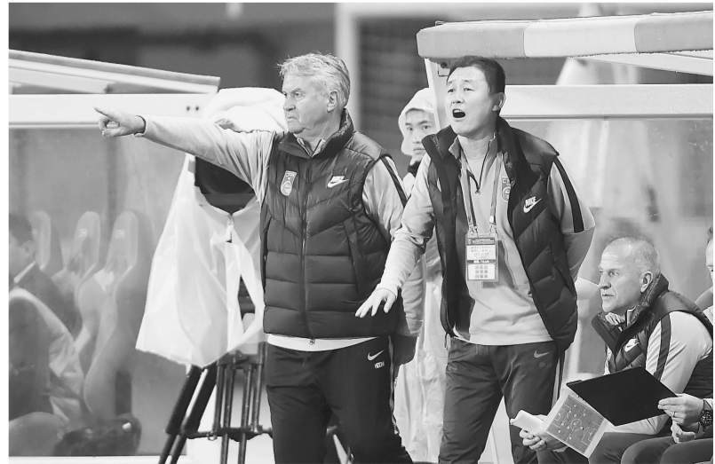
11月15日，中国U21男子足球队主教练希丁克(左一)和中方教练组长孙继海(左二)在场边指挥。当日，在重庆举行的2018年中国足协中国之队国际青年足球锦标赛中，中国U21男子足球队以1:0战胜泰国U21男子足球队。

同日，爵士队客场崩盘，被独行侠以118:68横扫，结束三连胜；奇才119:95大胜骑士；魔术111:106战胜76人；篮网107:120不敌热火；猛龙104:106惜败活塞；雄鹿113:116负于灰熊；雷霆128:103大胜尼克斯；森林狼107:100战胜鹈鹕；太阳116:96大胜马刺。