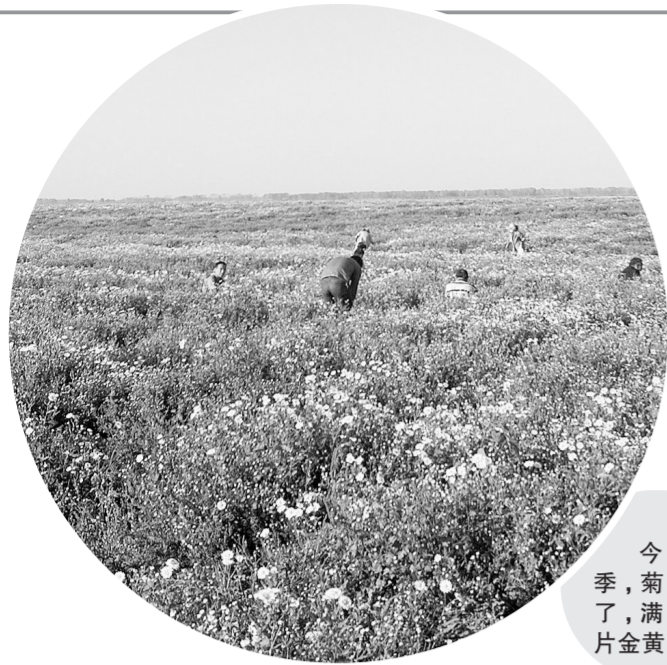
今年秋季,菊花熟了,满地一片金黄

菊花种植项目采用公司+农户+合作社+种植基地的模式,由中药公司提供种苗及全程技术跟踪指导,订单式种植,负责产品的整体销售。中药公司回收的原药材在烘干房经过烘干等粗加工后,可以直接销售给中成药制药企业和饮料厂,形成完整的产业链,有效带动本地的中药材发展和销售。