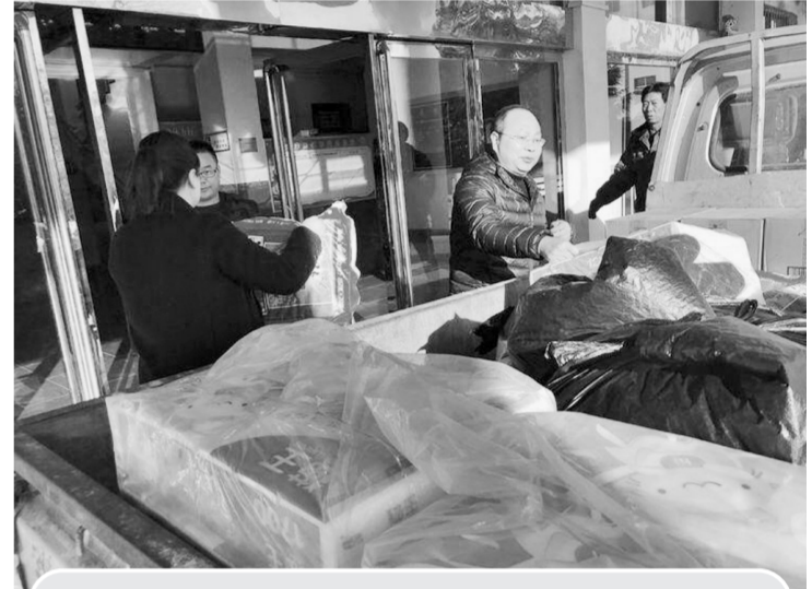
日前,巩义市永安路街道为夹津口镇扶贫驿站送去洗衣粉、洗洁精、棉拖鞋等各类日常生活用品192件,价值约6000元,为扶贫驿站补充供给,为贫困户温暖过冬提供保障。

新生的中青大厦团总支将成为联系基层和服务青年的坚强堡垒,将从三方面开展楼宇团建:楼宇党建和团建同步谋划和推进,形成党建组织积极“带”,团组织主动“跟”,楼宇党建建设“同轴共转”的工作态势。推动楼宇团建开放互联,形成“一个核心、多个堡垒”的区域化、集群式、嵌入式的楼宇团建网络。通过购买社工服务全面把握楼宇内团员青年聚集起来,增强社会责任感和荣誉感,让楼宇内外的青年深度融合,主动融入区域化团建工作大局。