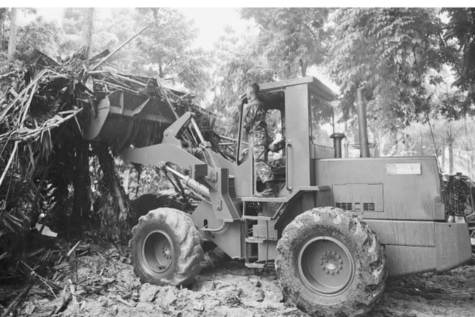
12月25日,救援人员在印尼万丹省展开清理工作

据新华社雅加达12月25日电(郑世波)印度尼西亚抗灾署25日通报说,印尼西部巽他海峡22日晚发生的海啸已造成429人遇难,另有超过1.6万人撤离。搜救工作正在紧张进行。