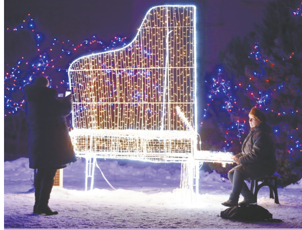
12月28日，在白俄罗斯首都明斯克，游人在公园里的钢琴造型灯光作品旁拍照。