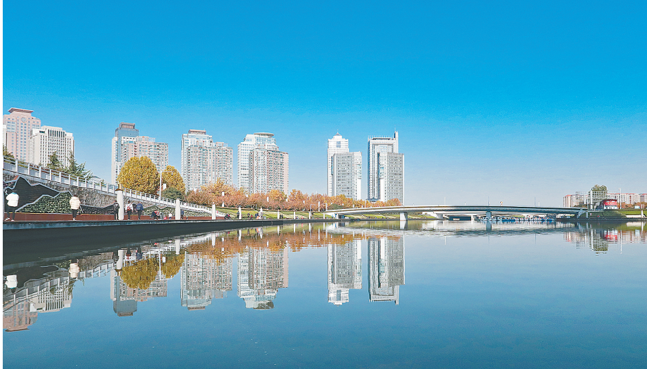
郑州把百城建设提质工程和文明城市创建工作有机结合统筹推进,着力做好以水润城、以绿荫城、以文化城、以业兴城“四篇文章”,绿城颜值更高气质更佳(资料图片)。

上跨陇海铁路工程主线建成通车,郑州市“大三环”快速路系统正式闭合,实现畅通郑州建设的历史性跨越。