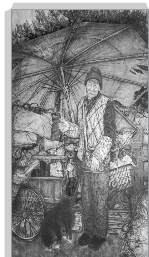
烤红薯的老人(国画) 吴永波