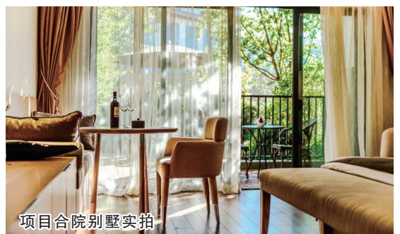
项目合院别墅实拍

2012~2017年,丽江旅游业发展势头良好,旅游人数不断增长,6年年均复合增长率达20.54%。