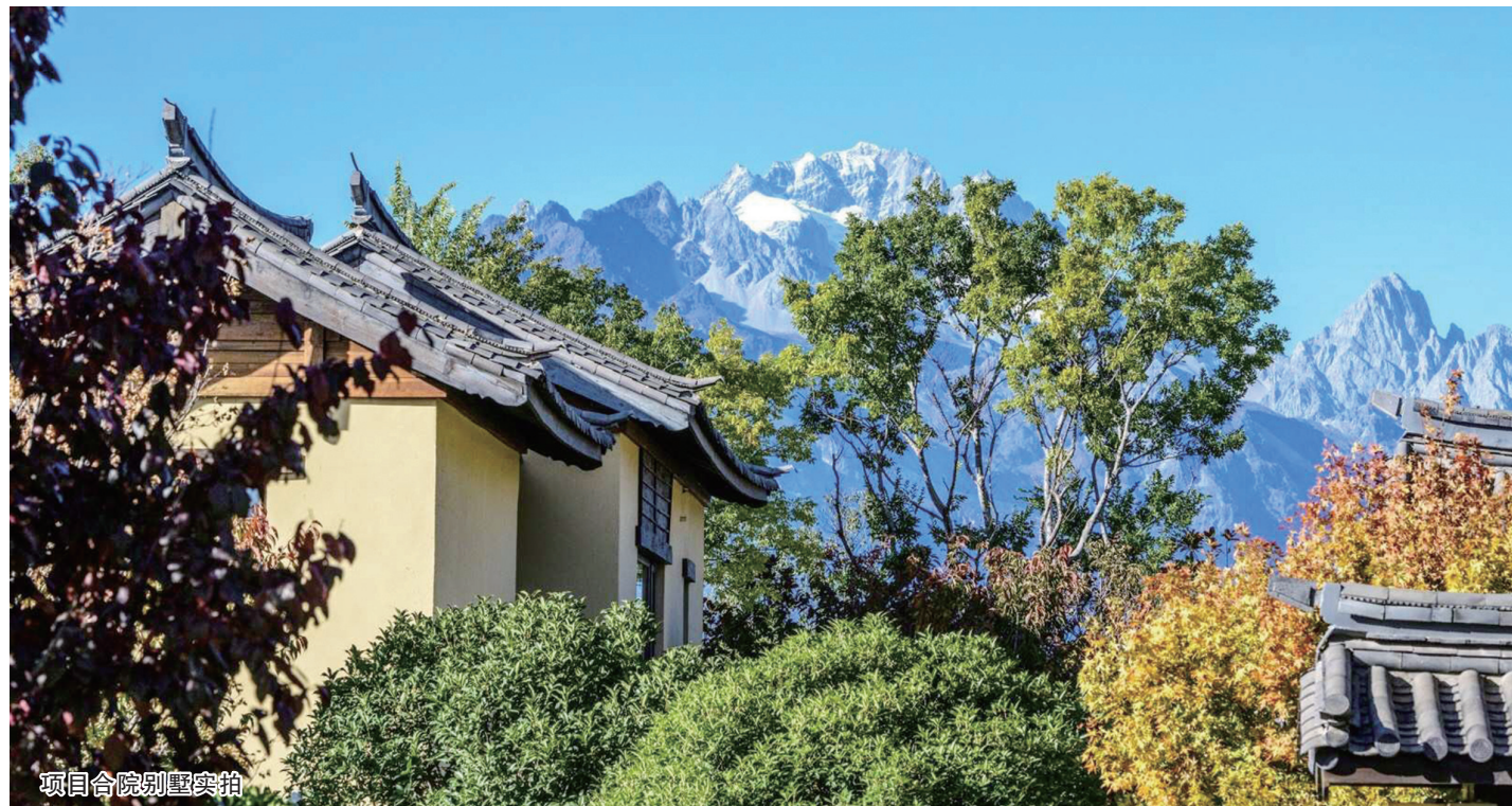
项目合院别墅实拍