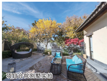
项目合院别墅实拍

海南房地产市场起步早,市场化程度高,购房群体来自全国乃至全球,拥有一套海南的海景房,成为追求海居生活人群的一大奢望。近10年来,三亚房价直线上升,特别是湾区的房价飙升,房价在每平方米数万元至十数万元不等,总体处于高位水平。去年以来,海南大力建设自由贸易区和自由贸易港,逐步去地产化,严格控制新增建设用地,实施严苛的限购政策,海南购房门槛越来越高,让购房者望之兴叹。