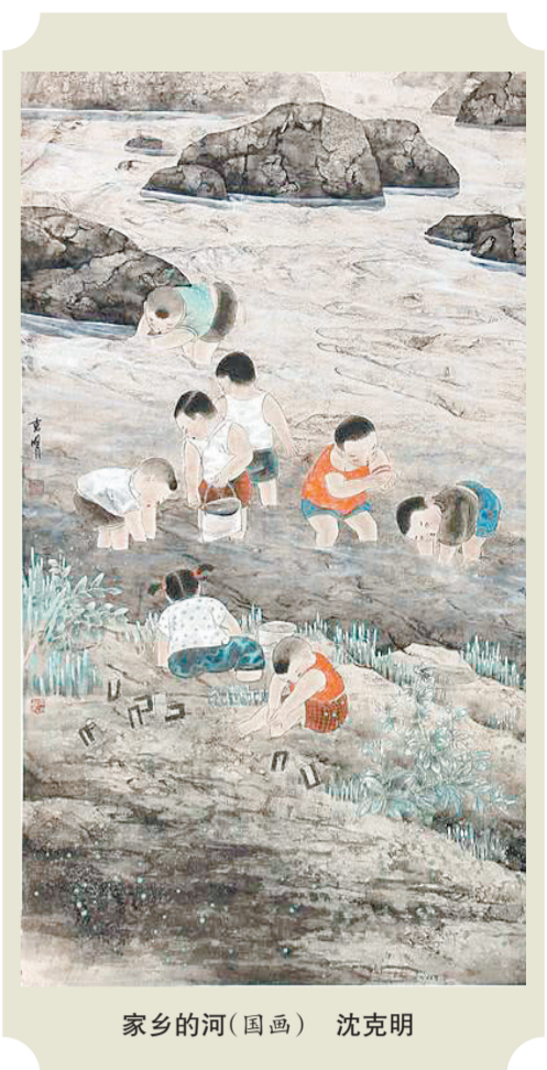
家乡的河(国画) 沈向明

在这岁尾之时,品不到蜡梅的美食,没有思念中的人,雪中蜡梅开放的身姿,能在想象中复生,也是挺好的。