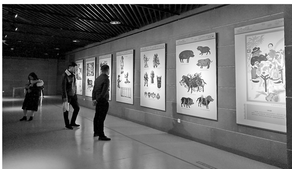
“金猪拱福——己亥新春生肖文物图片联展”吸引了众多市民观赏