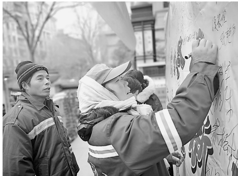
环卫工人纷纷写下新春祝福

休闲安逸的春节到了,对于众多城市环卫工人来说,却是忙碌的开始。怎样让过年还要忙碌的他们也享受到节日欢乐呢?