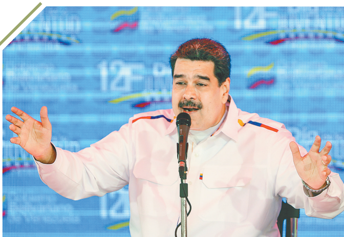
2月12日,在委内瑞拉首都加拉加斯,委总统马杜罗在委内瑞拉青年节活动上向支持者发表讲话。委总统马杜罗12日下午在首都加拉加斯表示,希望委内瑞拉远离战争威胁并保持和平现状。

美联社报道,这两份草案暂时没有在安理会传阅,不清楚是否会予以讨论和表决。新华社特稿