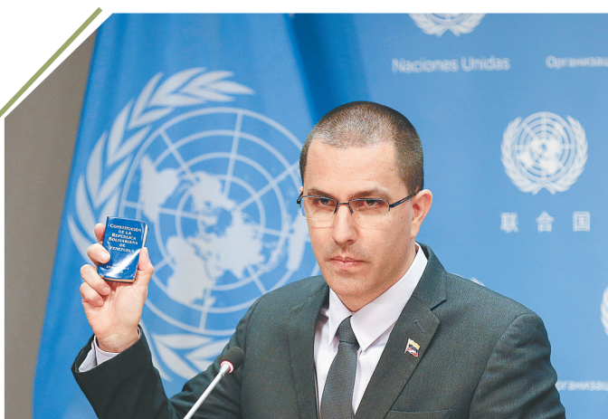
2月12日,在位于纽约的联合国总部,委内瑞拉外交部长阿雷亚萨出席记者会。据委内瑞拉国家电视台报道,委内瑞拉外交部长阿雷亚萨12日敦促国内反对派脱离对美国的依赖,通过和平方式解决委内瑞拉目前的政治问题。