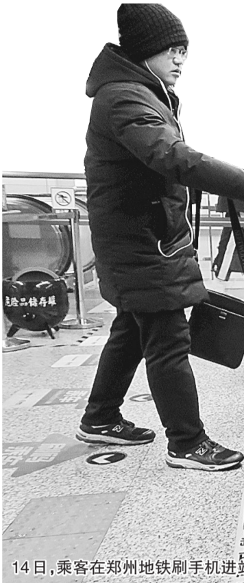
14日,乘客在郑州地铁刷手机进站

据郑州地铁集团有限公司技术人员称,郑州地铁·商易行扫码乘车APP今日上线,标志着郑州地铁开启智能出行、扫码出行新时代。今后所有新建地铁线路也将全部实现手机扫码乘车,人们在郑州乘地铁将会变得十分便利、快捷。