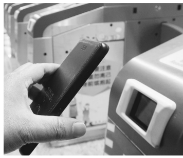
轻轻一扫,即可过闸