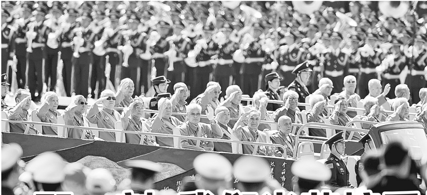
这是抗战老兵乘车方队通过天安门广场。